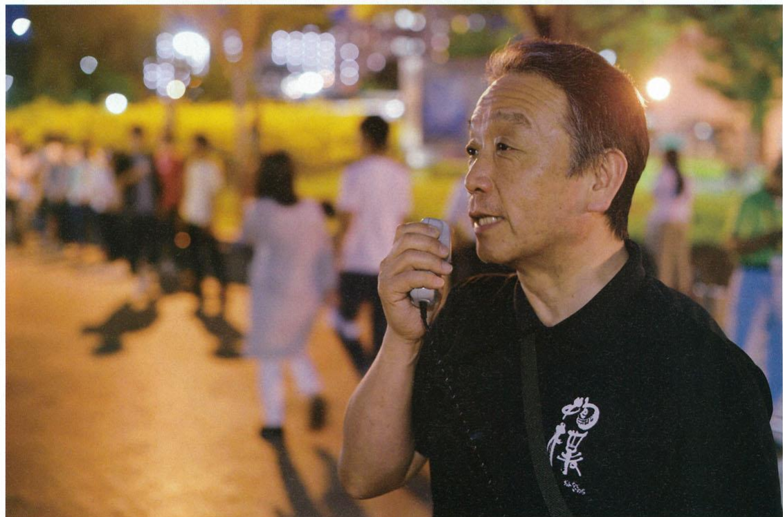
団体名の抱樸は、原木をそのまま抱き、抱かれた原木がやがて道具となってだれかの助けとなるという意。きずなの社会が必要だと語る