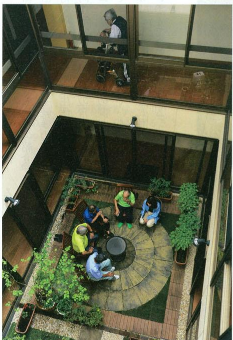
抱樸館北九州には約 30 人が入居する。生活のリズムをつくり、共同生活でひとのきずなを回復する