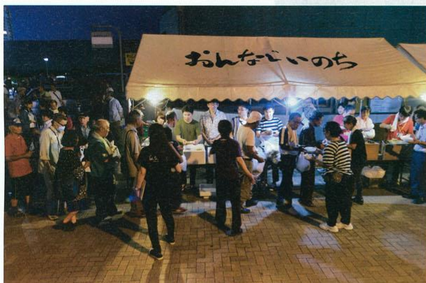
年間 30 回以上の炊き出しの物資の多くは協力者・団体の提供によるもの