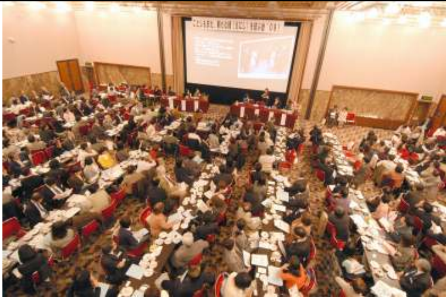
「えにし」を結ぶ会 第13回のことしは4.27