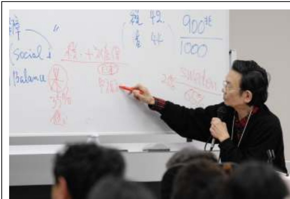
與謝野馨さんの がん再発の身をおしての遺言のようなプレゼンテーション